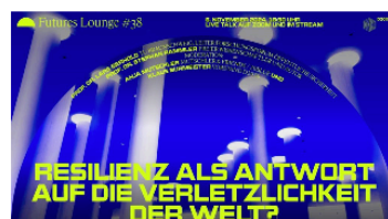
Futures Lounge #38: Resilienz als Antwort auf die Verletzlichkeit der Welt?