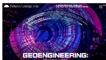
Futures Lounge #39: Geoengineering – Mission possible?