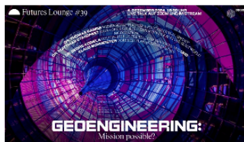
Futures Lounge #39: Geoengineering – Mission possible?