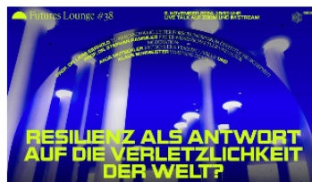
Futures Lounge #38: Resilienz als Antwort auf die Verletzlichkeit der Welt?