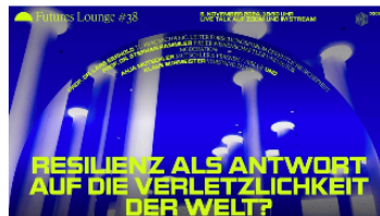
Futures Lounge #38: Resilienz als Antwort auf die Verletzlichkeit der Welt?